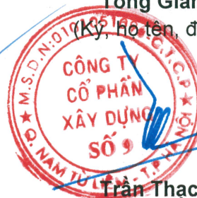
Trần Thạch Tân