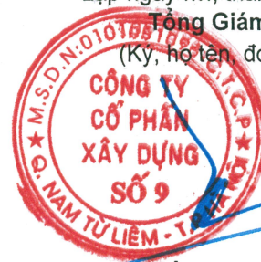
Trần Thạch Tân