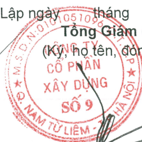
Trần Thạch Tân