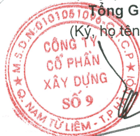
Trần Thạch Tân